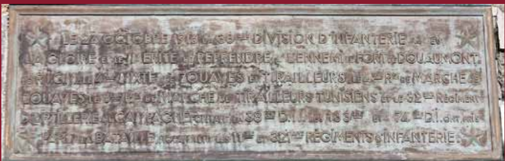
Plaque commémorative de la prise du fort de Douaumont par la 38 e division d'infanterie, 24 octobre 1916.