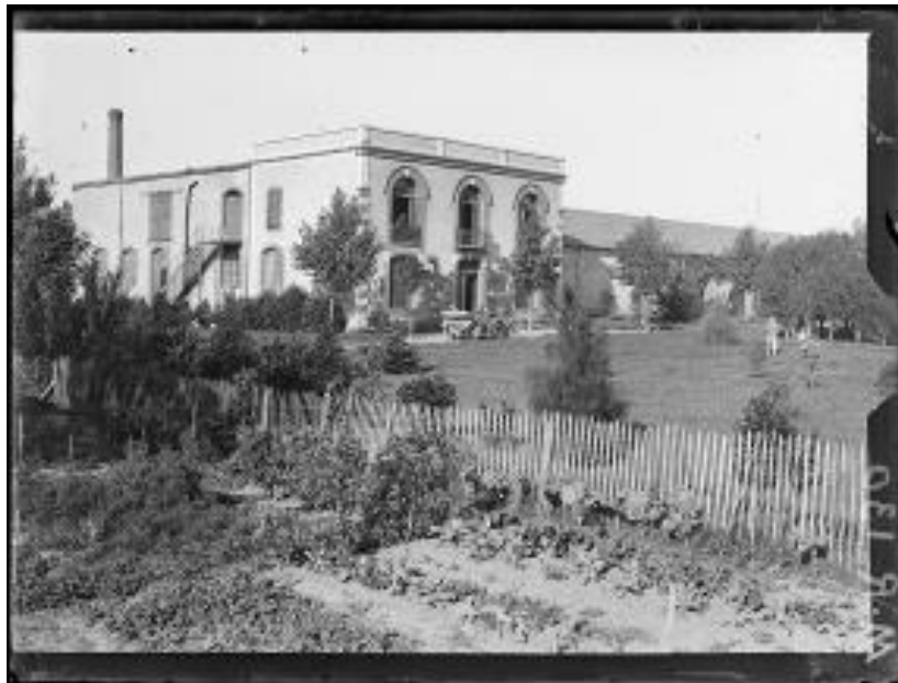
Référence : SPA 4 MR 130 Camarès. Vue générale de l'usine de La Bouriette fabriquant du tissu militaire. Septembre 1917.