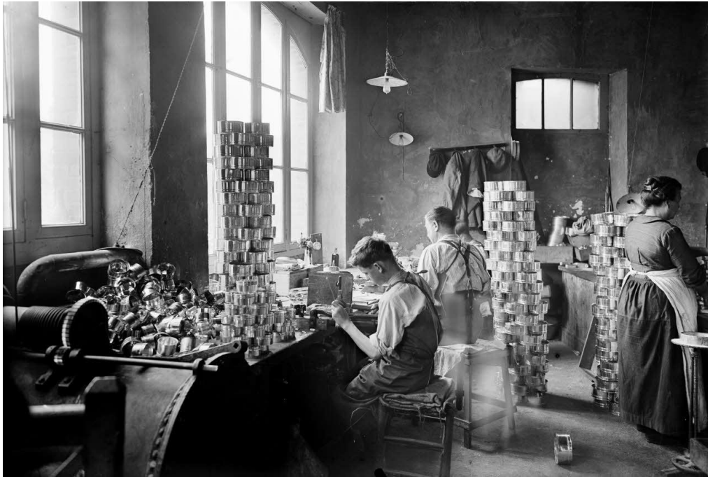
Référence : SPA 31 P 345 Soudage des boîtes de conserves. 18 juin 1916.