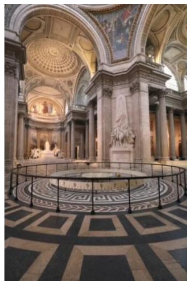
Pendule de Foucault - © François Pournin / Centre des monuments nationaux

Enfin, la présence du pendule de Foucault est remarquable. Cette expérience scientifique installée par Foucault lui-même en 1851 est constituée d'une sphère métallique de 47 kg suspendue à un fil de 67 mètres. Elle démontre la rotation de la Terre sur elle-même.