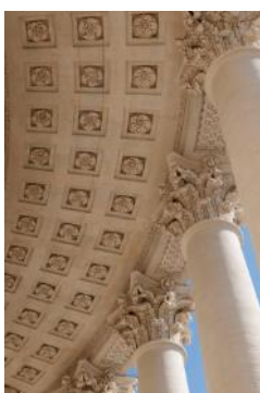
Panthéon, péristyle du tambour du dôme, plafond à caissons