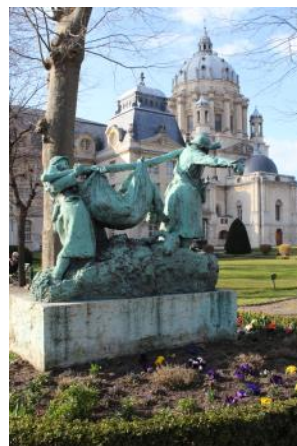
2 - Paris, Vème Val-de-Grâce