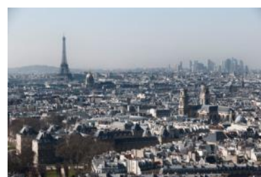
Vue sur l'ouest de Paris depuis le Panthéon