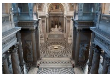
Panthéon, vue en direction du chœur depuis la tribune

Cet important chantier de restauration avait entraîné la fermeture au public des parties hautes de l'édifice. Le Centre des monuments nationaux est ainsi heureux d'annoncer leur réouverture depuis le 1 er avril 2016 et de les présenter à nouveau au public dans leur état voulu par Jacques-Germain Soufflot, avec leur lustre d'antan.