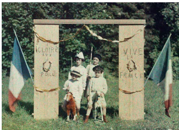
4 - La Guerre des Gosses (Epilogue) – Défilé des armées victorieuses sous l'Arc de Triomphe © Léon Gimpel – Commissariat de Luce Lebart, SFP