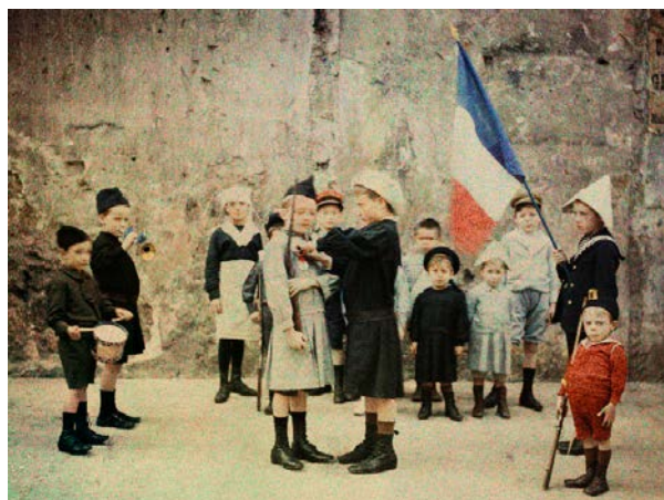
5 - « L'armée de la rue Greneta », Remise d'une décoration sur le front des troupes