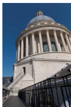
Panthéon, dôme vu depuis la coursive sud-ouest