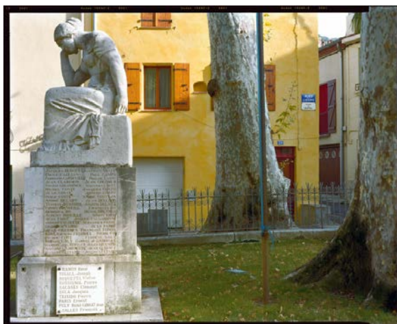
3 - Languedoc-Roussillon, Pyrénées-Orientales, Céret