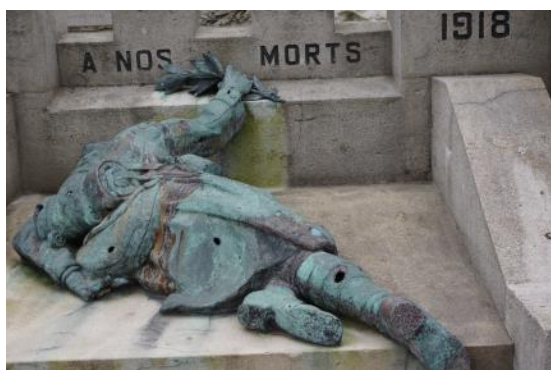
1 - Bergues - © Martine Aubry