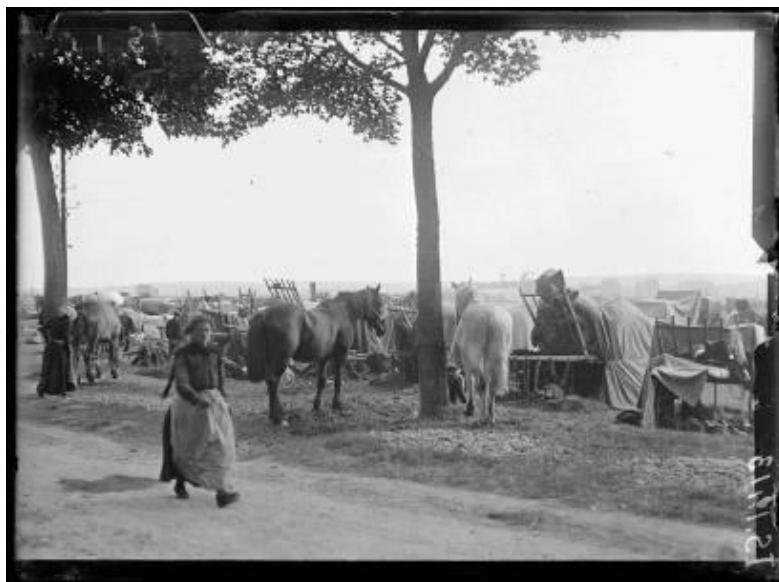
Référence : SPA 34 IS 1413 Région de Sens, Yonne. Des évacués de la région d'Épernay (Marne) campent dans les environs de Sens. 7 juin 1918.

L'ECPAD conserve deux reportages photographiques consacrés en totalité au département de l'Yonne, réalisés en 1918 par la Section photographique et cinématographique de l'armée (SPCA). Le premier, qui ne comprend qu'un seul cliché, représente un camp de réfugiés de la région d'Épernay installé près de Sens, le second, comprenant une douzaine de plaques stéréoscopiques, illustre les différentes étapes de l'installation d'un parc automobile à Villeneuve-sur-Yonne (construction des garages, débarquement des véhicules depuis les péniches naviguant sur l'Yonne).