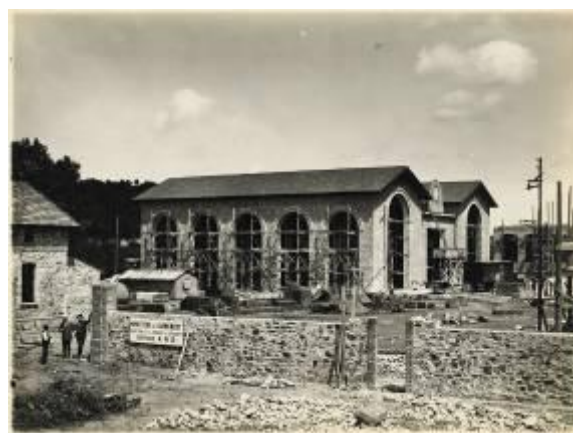
Référence : D23-45 Construction de l'usine de cyanamide de Carmaux. 23 mai 1918.