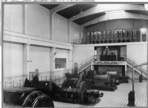
Référence : D23-5 Construction de l'usine de cyanamide de Carmaux. 23 mai 1918.