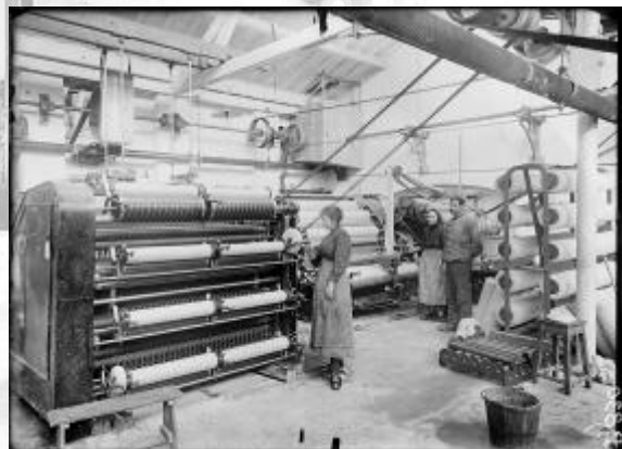
Référence : SPA 78 P 830 Usine de délainage Jules Cornioues, les cardes en fonctionnement. Février 1917.